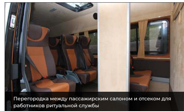
Перегорodka между пассажирским салоном и отсеком для работников ритуальной службы